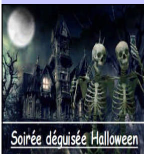
Soirée déguisée Halloween